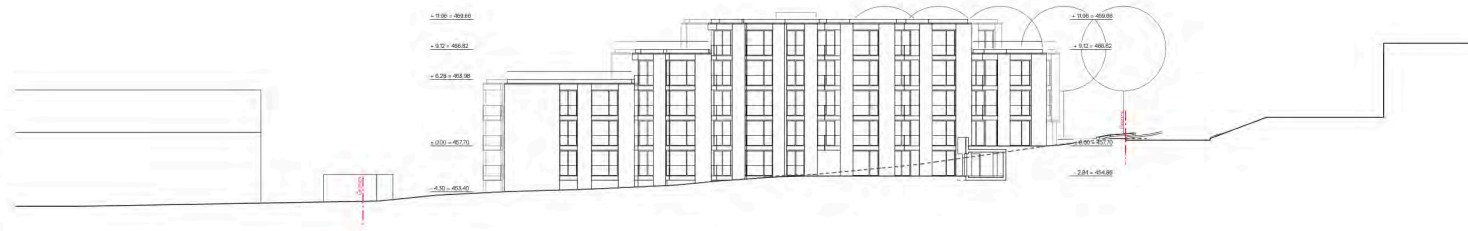
Haus A: Ansicht Südfassade