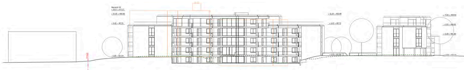
Haus B: Ansicht Ostfassade