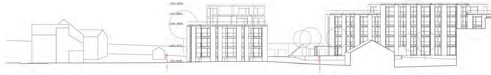
Haus A: Ansicht Westfassade